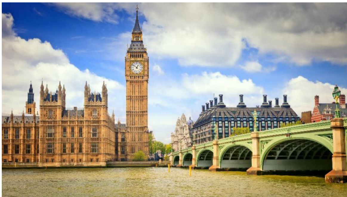
大本钟和国会大厦