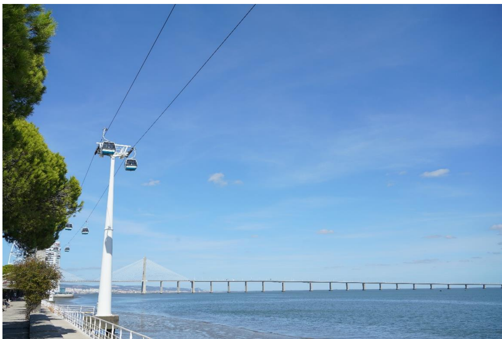
里斯本达伽马大桥

里斯本不同于世界其他主要大城市，行政上的“里斯本市”只局限在历史城区，占地100平方公里，其周边卫星城属于里斯本大区的一部分。里斯本市人口约56.71万人，里斯本大区人口约289万人。里斯本大区是葡萄牙最富庶的地区，人均GDP远高于全国平均水平。