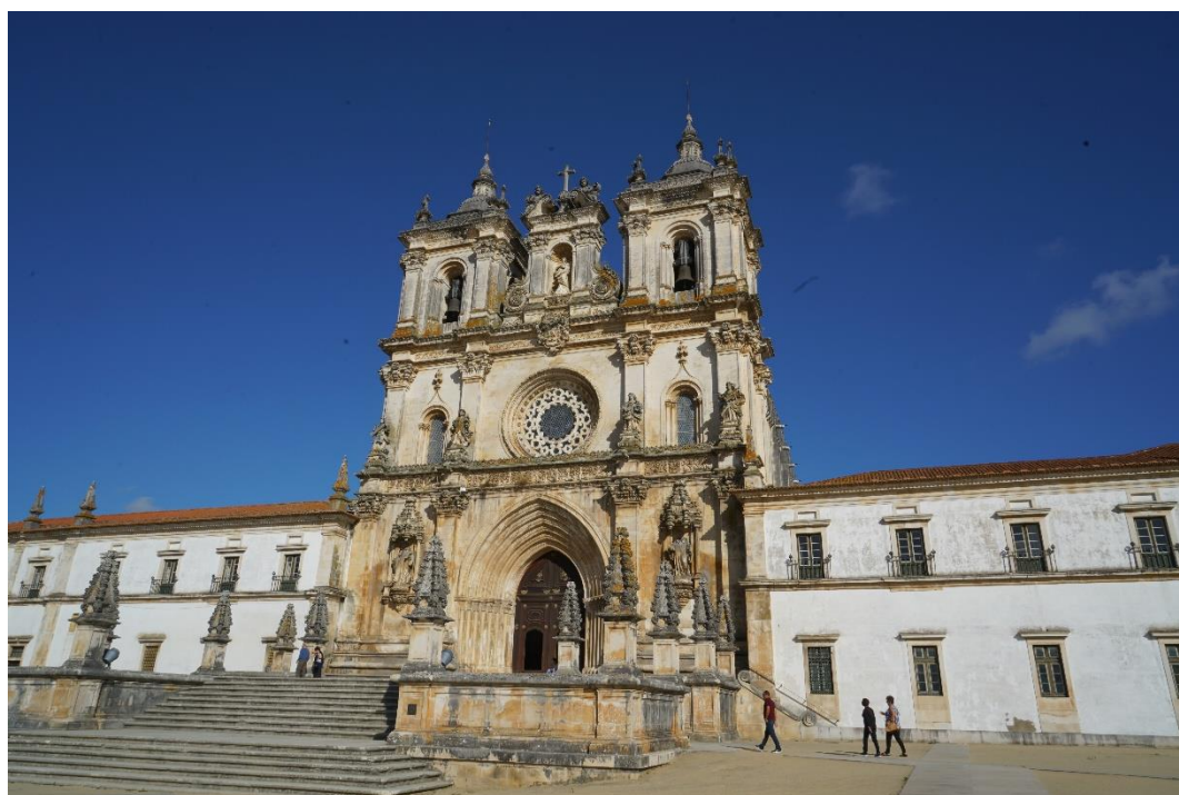
阿尔克巴萨修道院

【罢工】 根据葡萄牙就业与劳动局公布的数据，2023年葡萄牙共举行大大小小1495次罢工活动，较上年增加38%，罢工次数创近十年来记录。超四分之一罢工涉及行政服务，通货膨胀导致生活成本上升、希望提高工资水平是罢工次数增加的主要原因。2024年1—5月累计罢工467次。在葡萄牙的中资企业未发生罢工情况。